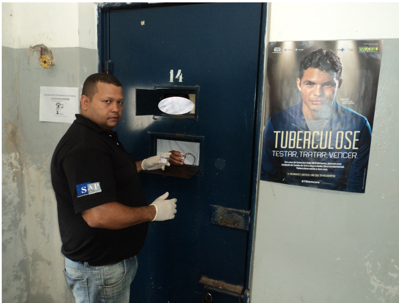
Busca Ativa na P. de Casa Branca