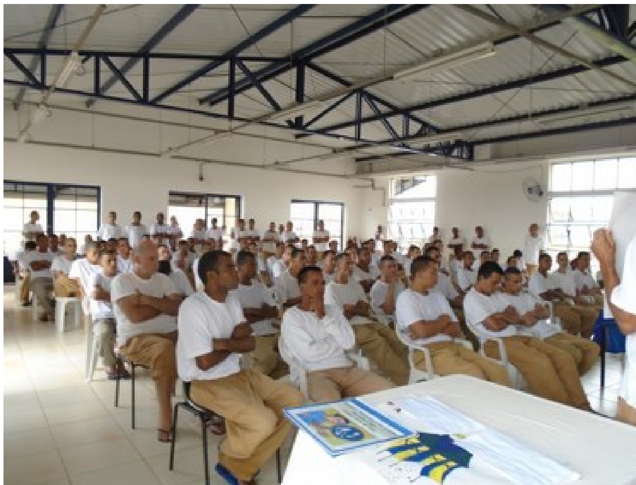
Palestra no Espaço Ecumênico do CPP de Jardinópolis