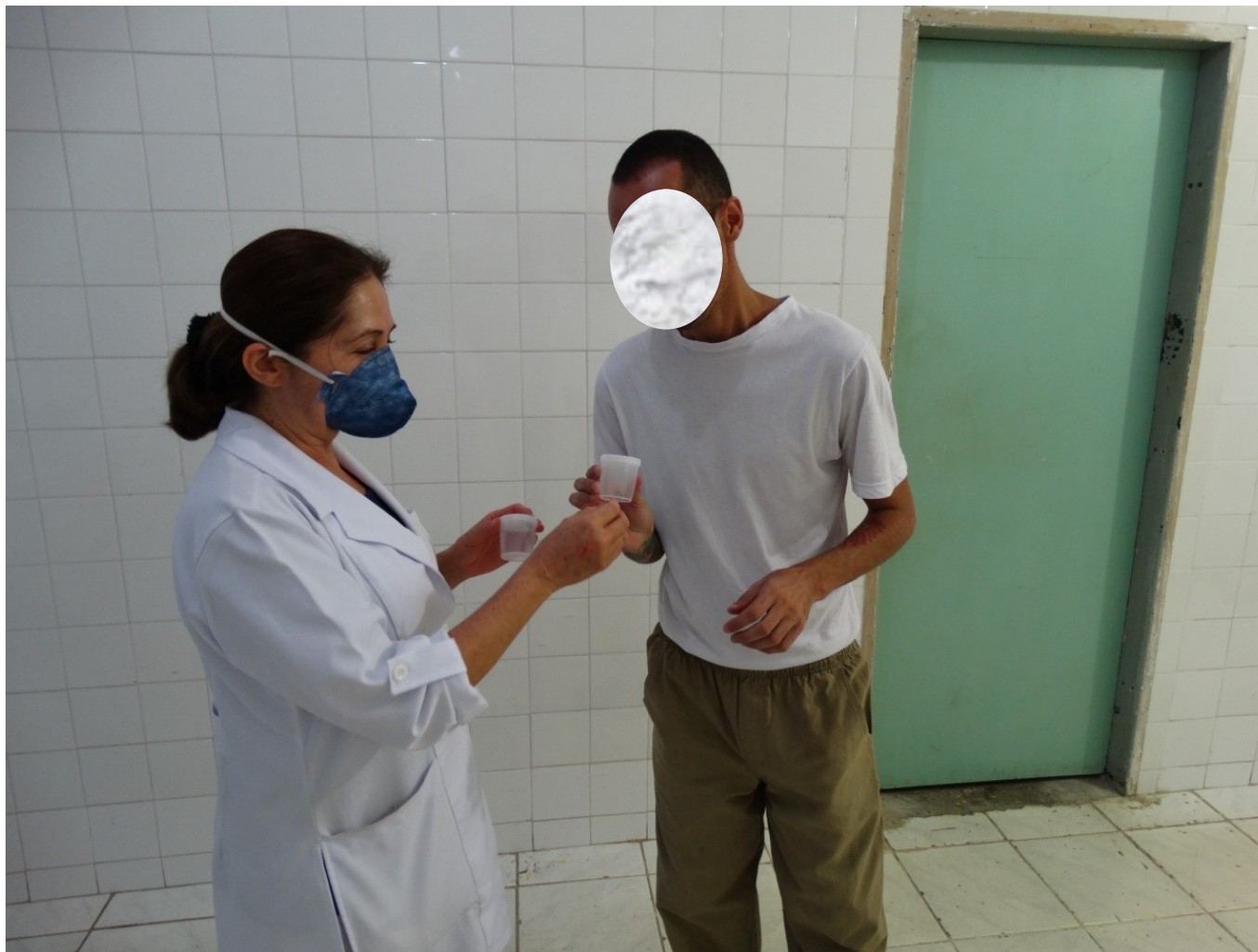
Busca Ativa na P. I de Guarulhos