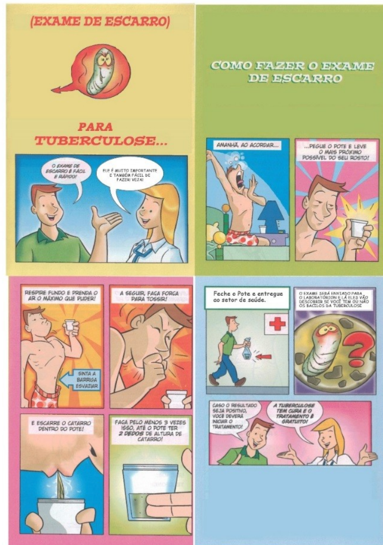
Folheto explicativo em A5