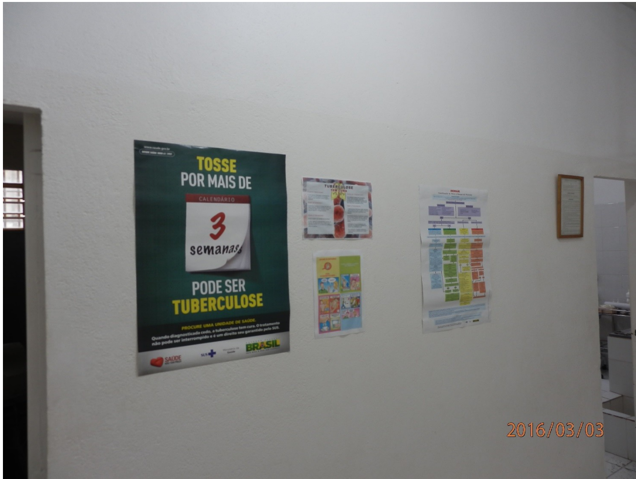
CDP de Campinas